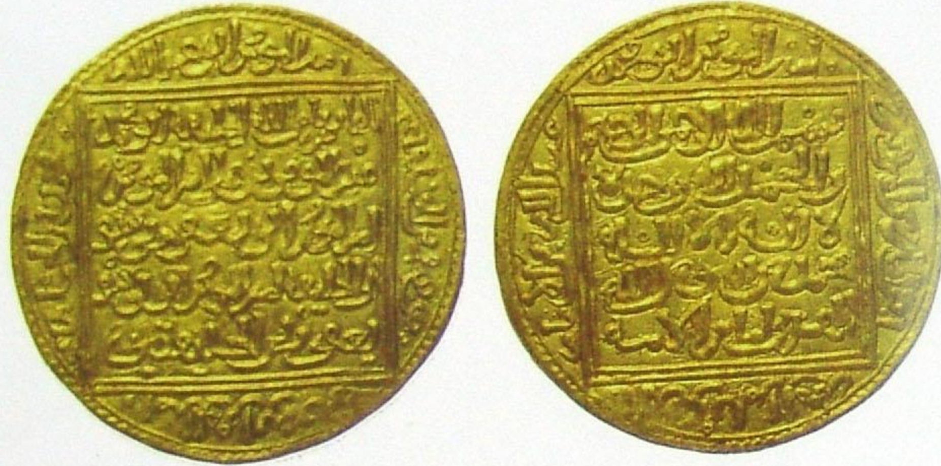
دينار بنو حفص